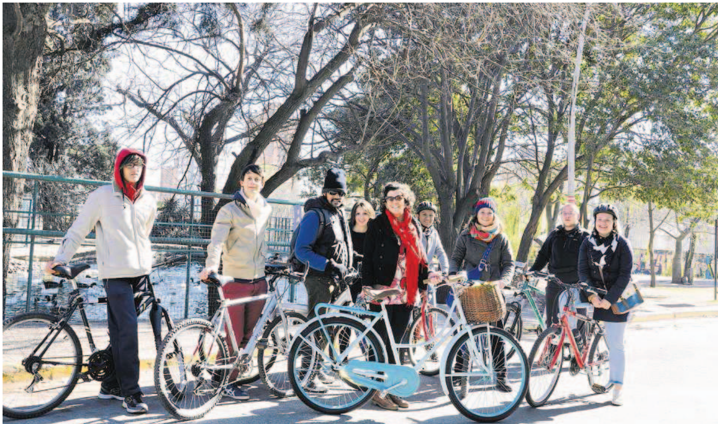
Die «Symbiose Gemeinschaft» setzt sich in Argentinien für nachhaltiges und soziales Wirtschaften ein.